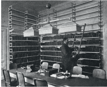
Vermutlich Bibliothek des Instituts für Philosophie und Treffpunkt des Wiener Kreises, Boltzmannngasse 5

Durch bauliche Modernisierungen existieren die historischen Räume, in denen sich der Wiener Kreis traf, nicht mehr in ihrer ursprünglichen Form. Eine Besichtigung ist daher nicht möglich.