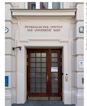
Eingang Boltzmanngasse 5

„Im Erdgeschoss dieses Gebäudes traf sich der philosophische Diskussionszirkel um Moritz Schlick (1882 – 1936), der als Wiener Kreis Weltgeltung errang. Mord und Vertreibung führten zu dessen Auflösung, doch sein Erbe prägt bis heute das Denken in Philosophie und Wissenschaft.“