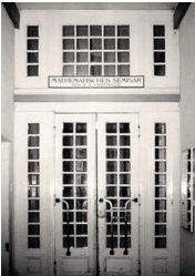
Eingang zum damaligen Mathematischen Seminar